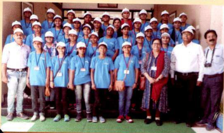
શૈક્ષણિક પ્રવાસ : મુદ્રા પોર્ટ અને SEZ