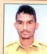
અમાર શેલેષ કે. વ્યાયામવીર B.Com. - IV