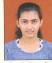
કોહારી નેયા જે. વીરબાળા