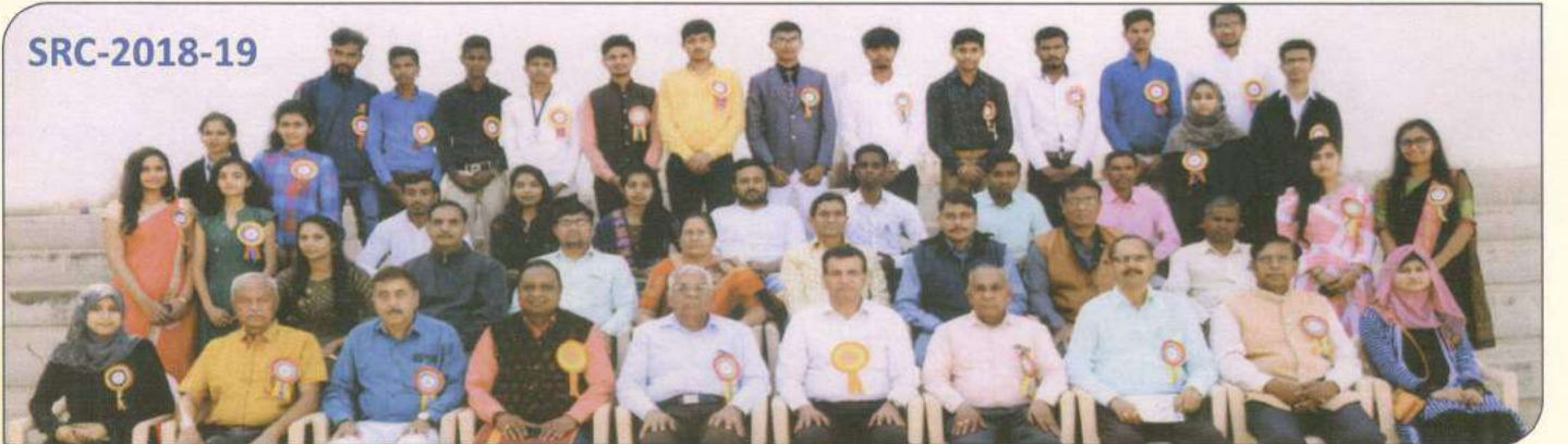
મંડળના પ્રમુખશ્રી, માનદ્મંત્રીશ્રી, મહેમાનશ્રીઓ, કોલેજ વર્ગ પ્રતિનિધિઓ સાથે કોલેજ સ્ટાફ પરિવાર