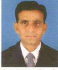
ડૉ. કનુભાઈ પી. પટેલ સાયન્સ કોલેજ