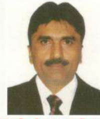
ડૉ. હિમીનભાઈ ડી. પટેલ એજ્યુકેશન કોલેજ