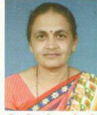
શ્રીમતી ગીતાબેન બી. નિનામા ડી.એલ.એડ્ કોલેજ