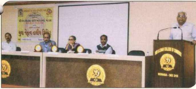
N.S.S. ની વર્ષ 2018-19ની યુવા નેતૃત્વ તાલીમ શીબિરમાં N.S.S. ગુજરાતના અધિકારીશ્રીઓ તથા યુનિ. ના સંયોજકશ્રી