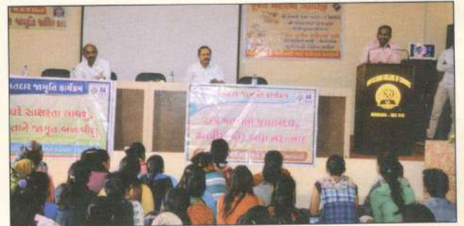
મતદાન જાગૃતિ (SWIP) ના કાર્યક્રમમાં અરવલ્લી જિલ્લા કલેક્ટરશ્રી નાગરાજનનું સંબોધન