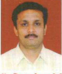
ડૉ. દિપક એચ. જોષી આર્ટ્સ કોલેજ