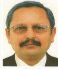
ડૉ. સુધીર ગી. જોષી કોમર્સ કોલેજ