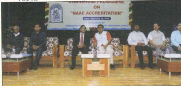
હેમ.છી.ગુ. યુનિ., પાટણ ખાતે NAAC એવરનેસ પ્રોગ્રામ અને વક્તા તરીકે આચાર્યશ્રી