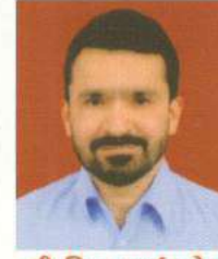
શ્રી દિપકભાઈ પટેલ ઈંગ્લીશ મીડીયમ સ્કુલ (માધ્યમિક)