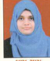
ગાંધી સારા B.Com. Uni. Ranker-2018