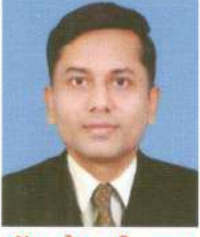
ડૉ. પરેશ બી. શાહ ફાર્મસી ડીપ્લોમા કોલેજ