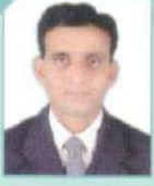
ડૉ. કનુભાઈ પી. પટેલ સાયન્સ કોલેજ