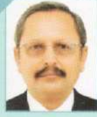
ડૉ. સુધીર ગી. જોષી કોમર્સ કોલેજ