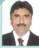
ડૉ. હિતબીભાઈ ડી. પટેલ એજ્યુકેશન કોલેજ