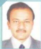
શ્રી દિપક એન. મોદી ઈંગ્લીશ મીડીયમ સ્કૂલ (પ્રાથમિક)