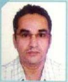
શ્રી શશીકાન્ત પરમાર ઈંગ્લીશ મીડીયમ સ્કૂલ (માધ્યમિક)