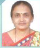
શ્રીમતી ગીતાબેન બી. નાનામા ડી. એલ. એડ્. કોલેજ