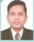
ડૉ. પરેશ બી. શાહ ફાર્મસી ડીપ્લોમા કોલેજ