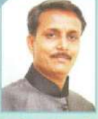
ડૉ. દીપક એચ. જોષી આર્ટ્સ કોલેજ